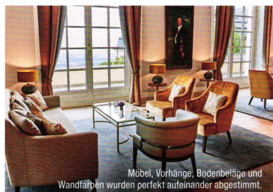
Möbel, Vorhänge, Bodenbeläge und Wandfarben wurden perfekt aufeinander abgestimmt.