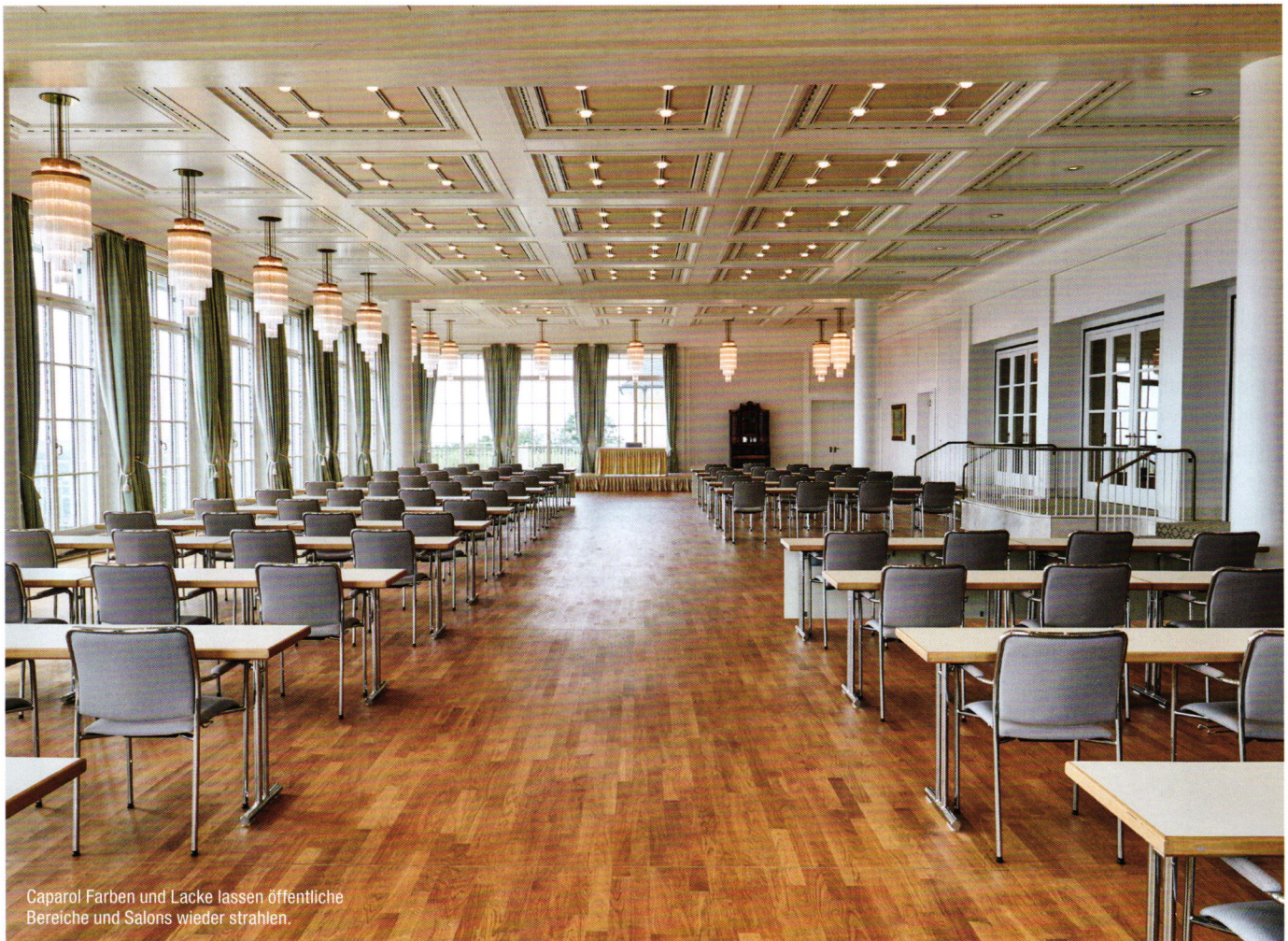
Caparol Farben und Lacke lassen öffentliche Bereiche und Salons wieder strahlen.