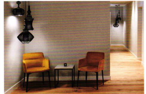
Streichen während dem laufenden Betrieb: Sicher mit Indeko-plus.