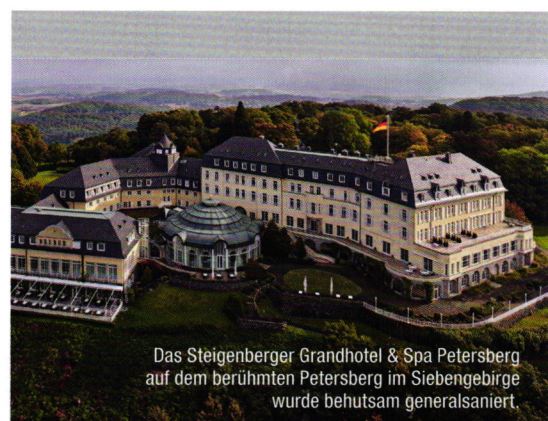
Das Steigenberger Grandhotel & Spa Petersberg auf dem berühmten Petersberg im Siebengebirge wurde behutsam generalsaniert.

Neben der hochwertigen Innenfarbe kam zudem der Premiumlack Capacryl PU Satin zum Einsatz, zum Beispiel in der prächtigen Rotunde des Hotels. Kratz- und stoßfest sowie beständig gegen Desinfektions-